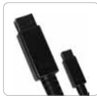
FireWire 800 -Kabel