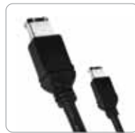
FireWire 400 -Kabel