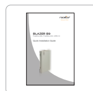
Manuel d'installation rapide