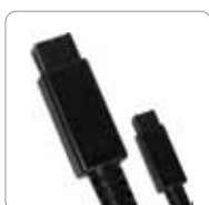
Câble FireWire 800