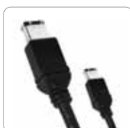
Câble FireWire 400