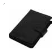
Étui de rangement