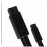
FireWire 800 -Kabel