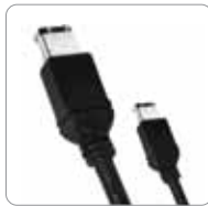
FireWire 400 -Kabel