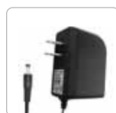
Adaptador de corriente alterna