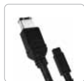
Cable FireWire 800 a 400 (9 a 6 pin)