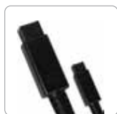
Cable FireWire 800 (9 a 9 pin)