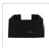
Base para montaje vertical