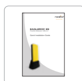
Guía de instalación rápida