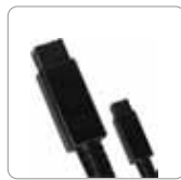
FireWire 800 (1394b) (9 bis 9-pin) Kabel