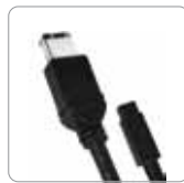
FireWire 400 bis 800 (1394a) (9 bis 6 pin) Kabel