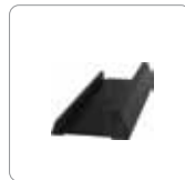
Stand zur vertikalen Anbringung