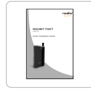
Manuel d'installation rapide