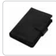
Étui de rangement