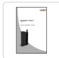
Guía de instalación rápida