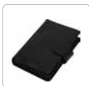
Étui de rangement