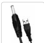
électrique en option