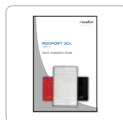
Manuel d'installation rapide