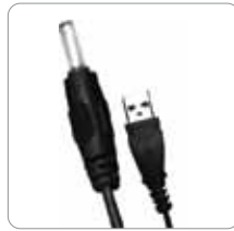
Adaptador de la CA