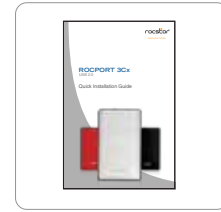
Guía de instalación rápida