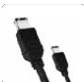
Câble FireWire 400