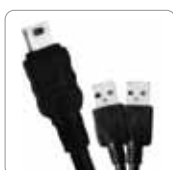
Câble USB électrique en option