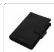
Étui de rangement