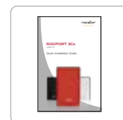
Manuel d'installation rapide