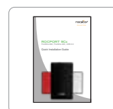
Guía de instalación rápida