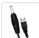
Adaptador de la CA