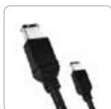
6-pin to 6-pin FireWire 400 (1394a) cable