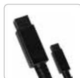
9-pin to 9-pin FireWire 800 (1394b) cable